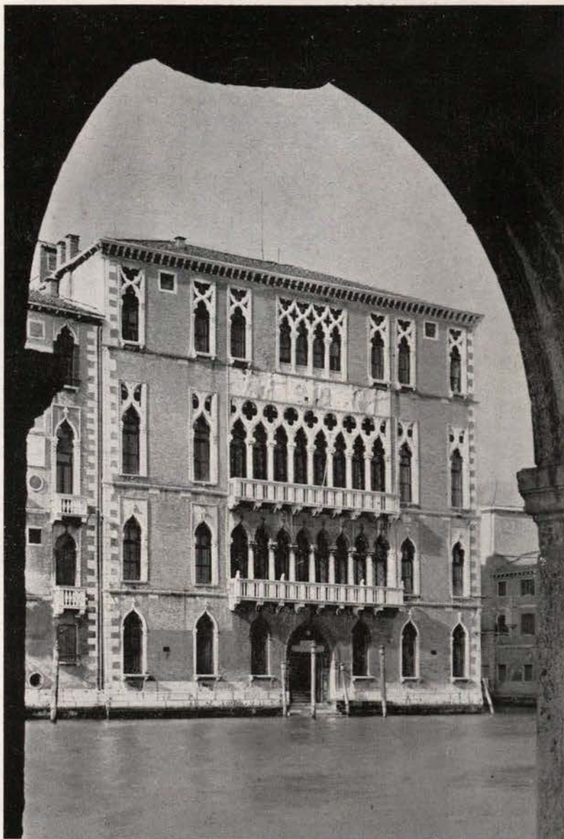
CA' FOSCARI - Facciata sul Canal Grande