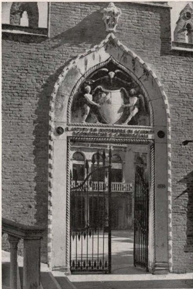
CA' FOSCARI - Portale