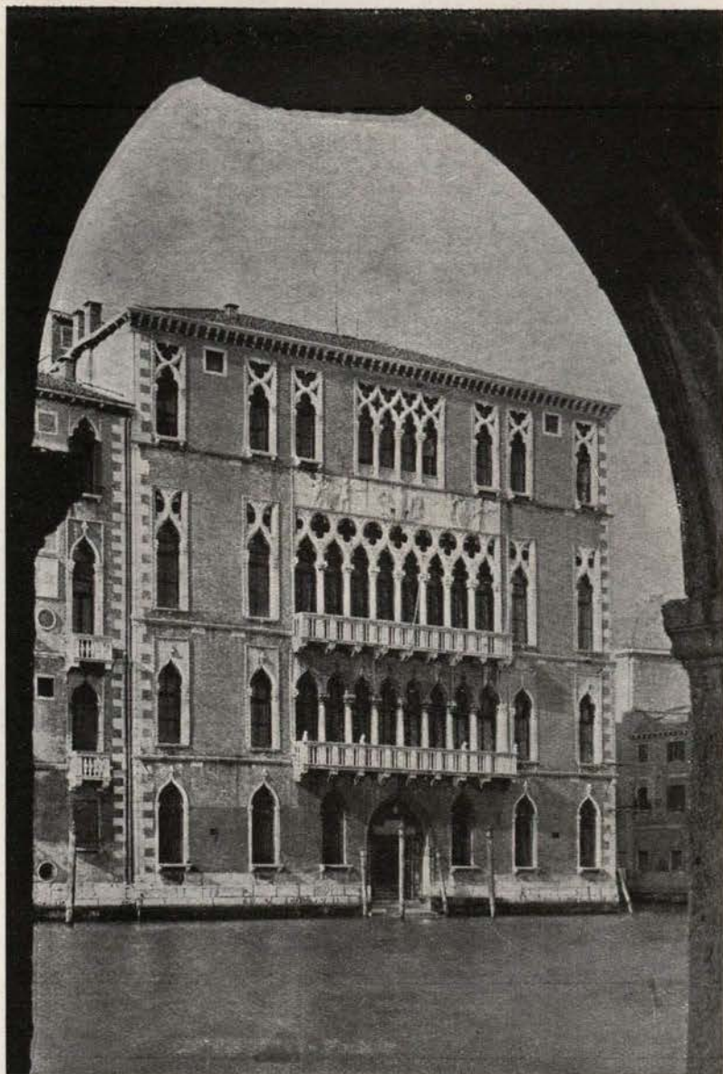
CA' FOSCARI - Facciata sul Canal Grande.