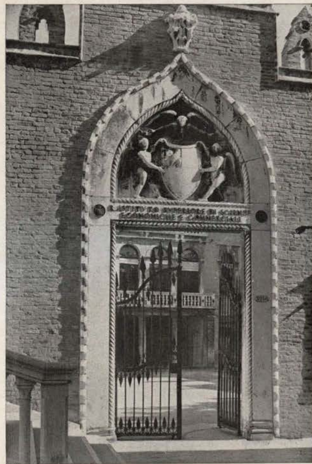
CA' FOSCARI - Portale.

Oggi l'unità è granitica, in confini insormontabili e l' Italia guarda al suo Impero come ad un retaggio più vasto; e mentre il mondo è inquieto e l'Oriente, che fu di Venezia, è percorso da profonde scosse, a noi piace immaginare che in questa ora fremano nei loro avelli, con gli antichi Imperatori di Roma, i grandi Dogi di Venezia, come per incoraggiare e rafforzare l'erculeo sforzo del Capo che in Roma tesse la grande tela e da Roma dirige l' Italia nella sua sicura ed inarrestabile ascensione.