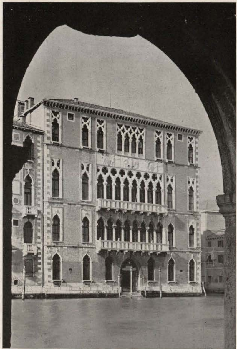
CA' FOSCARI - Facciata sul Canal Grande.