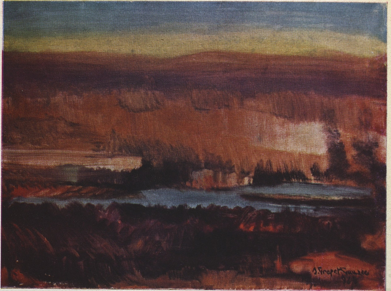
"TRAMONTO IN BARENA,"