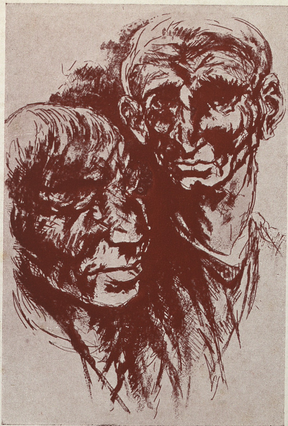
Gli etruschi - aquaforte - acquatinta