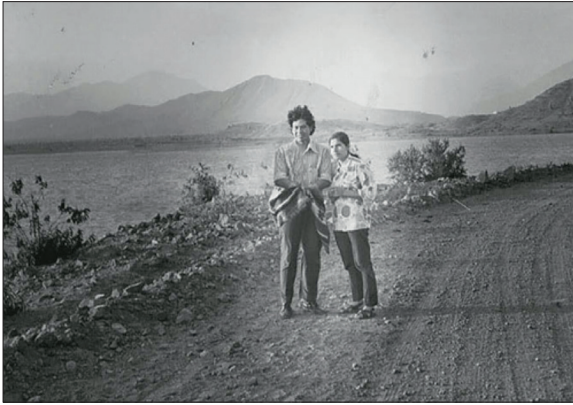
Figura 3 Agüero, Caminantes. 2017. Persona, © José Carlos Agüero

En las fotografías dos y tres, imagina qué hubiera sido de sus padres si no se hubieran conocido, si no hubieran entrado en política, si no hubiera muerto en el conflicto armado. Las fotos son nuevamente alteradas, esta vez eliminando a la madre en una, y en otra eliminando al padre y al hijo. Ese borramiento produce un extrañamiento sobre la identidad de Agüero como hijo, de sus padres como militantes de Sendero Luminoso, pero también en el lector que puede reflexionar qué pasaría con sus (propios) padres si no se hubieran conocido. Agüero titula a la segunda foto " Joven emprendedor con hija inocente " y a la tercera foto " Cantante ", lo que su madre le confió que hubiera querido ser. El último borramiento es la fotografía cuatro, donde esta vez solo aparecen los padres en el mismo paisaje rural en blanco y negro y ahora el bebé-autor ha sido borrado de la foto [fig. 4].