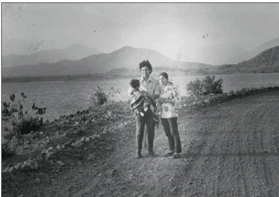
Figura 2 Agüero, Caminantes. 2017. Persona , © José Carlos Agüero

Por ejemplo, en la sección seis del libro ‘Origen’, Agüero utiliza una fotografía familiar en blanco y negro donde aparecen sus padres y él de niño en medio de un paisaje rural para manipularla y reflexionar sobre ella. En la primera versión de la fotografía, Agüero imagina el momento cuando la foto fue tomada y especula sobre la condición de los personajes de la foto [fig. 2].