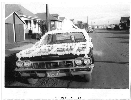
Figura 1 Macchina per matrimonio. 1967. Thunder Bay

La storia di Clara restituisce spessore e complessità all'immagine della 'moglie al seguito', così come sintetizzata dalla storiografia sul tema. Ci fa vedere come quella specifica combinazione di scelte - emigratoria e matrimoniale - si traduca in una trasformazione dal forte valore esistenziale: avere accesso alla sessualità, assumere il ruolo sociale di moglie e madre dispensatrice di cure domestiche e sentimentali. Emigrare, per le giovani donne 'al seguito', significava attraversare un confine esistenziale e assumere un preciso ruolo sociale, diventare donna a tutti gli effetti, 'diventar femina' - per usare l'espressione efficace di una delle signore intervistate. Dinamiche che, nel caso di Clara, come vedremo nei prossimi paragrafi, intervengono nella definizione del suo status lavorativo e nella ambigua autopercezione della rilevanza economica di molte mansioni svolte in ambito domestico proprio e altrui.