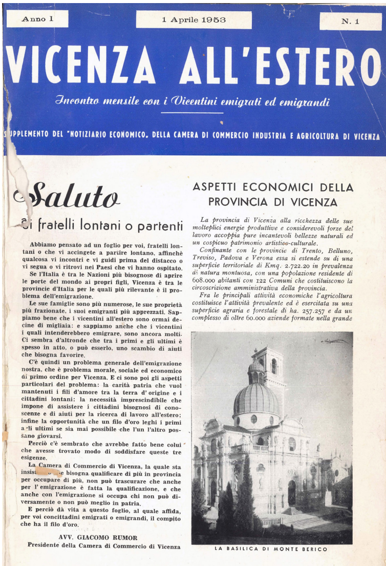
Figura 1 Il primo numero di Vicenza all'estero , aprile 1953

L'importanza del periodico nell'alimentare il legame degli emigrati con la propria terra d'origine fu messo in più occasioni in evidenza dagli stessi vicentini all'estero. Si veda, ad esempio, la reazione alla pubblicazione di immagini, foto e brevi reportage su Vicenza e sugli altri comuni del vicentino, un'iniziativa partita proprio su richiesta