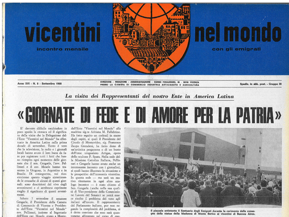
Figura 4 La cerimonia per la consegna della statua della Madonna di Monte Berico ai vicentini di Buenos Aires ( Vicentini nel mondo , settembre 1968)

Problemi ci sono - si legge in una lettera inviata a Vicenza nella primavera del 2002 - ma finché sopravvivranno due vicentini a Buenos Aires, continueremo a riunirci almeno per mangiare dei grustoli , pregare la Madonna e rammentare la Patria lontana. 48