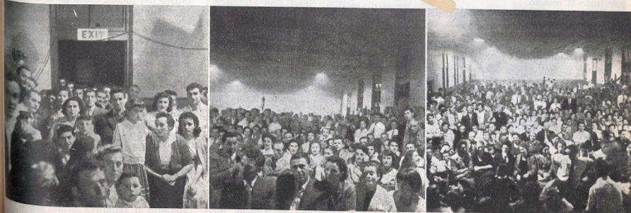
Figura 2 Uno dei primi scambi tra gli emigrati e Vicenza (Vicenza all'estero, maggio 1958)

La somma cortesemente inviata alla Camera di Commercio è stata devoluta in parti eguali agli « Enti di solidarietà fra emigranti » costituiti nei Comuni di Tonezza, Enego e Foza con lo scopo precipuo di assistere i familiari dei lavoratori che si recano all'estero per ragioni di lavoro e che, non di rado purtroppo, rimangono vittime di tragici incidenti o di malattie, rendendo quindi indispensabile l'intervento solidaristico degli Enti stessi.