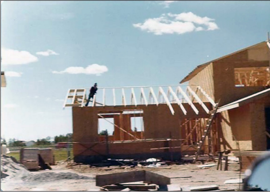
Figura 3 Casa in costruzione. Anni Settanta. Thunder Bay

veniva formalizzata direttamente tramite il matrimonio, appena prima della partenza.