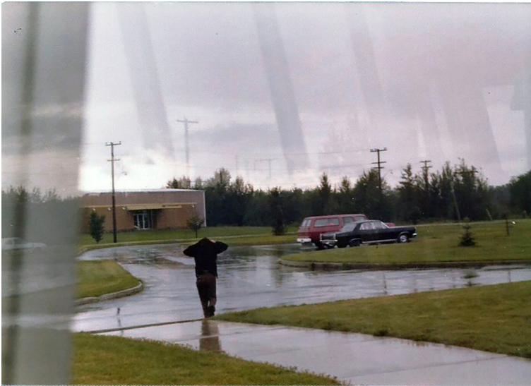
Figura 7 Thunder Bay. Agosto 1977

[...] Non ho mai pianto ma ero disperata, ero disperata. Mi mancava tutto mi mancava la mia famiglia, soprattutto, mi mancava le risate, la compagnia.