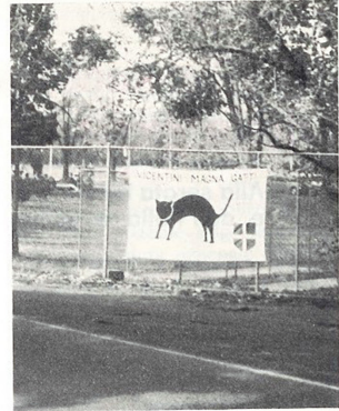
Al pic-nic si va di qui ...

La tradizionale partita a calcio tra giovani e adulti evocò poi passate abilità e destrezze di membra un po' arruginite.