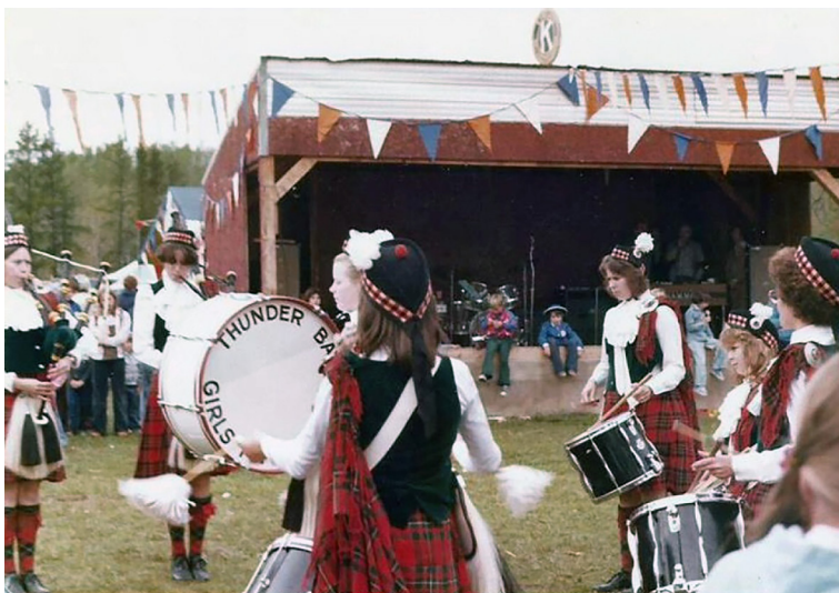
Figura 4 Parata in abiti scozzesi. 1977. Thunder Bay

svolta da questo contatto ravvicinato e 'intimo' con famiglie locali di status sociale più elevato: la modernità transita per i modelli, le forme e i materiali degli oggetti preziosi che riceveva in dono da queste signore canadesi.