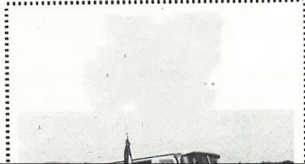
Figura 6 Un picnic organizzato dai vicentini di Melbourne (Vicentini nel mondo, luglio 1984)

Con il tiro alla fune e i corpi dei vinti sparpagliati per terra anche il tempo ne ebbe a sufficienza e si decise a farci prendere la strada di casa, come chi un giorno si divertiva nei lavori dei campi fino a quando arrivava il temporale che faceva caricare gli arnesi sul carretto e correre a più non posso.