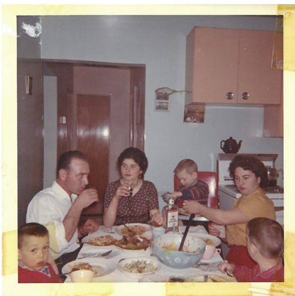
Figura 5 Interno domestico di emigranti italiani. Anni Sessanta. Thunder Bay