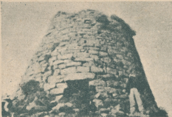
NURAGHE DI GONI