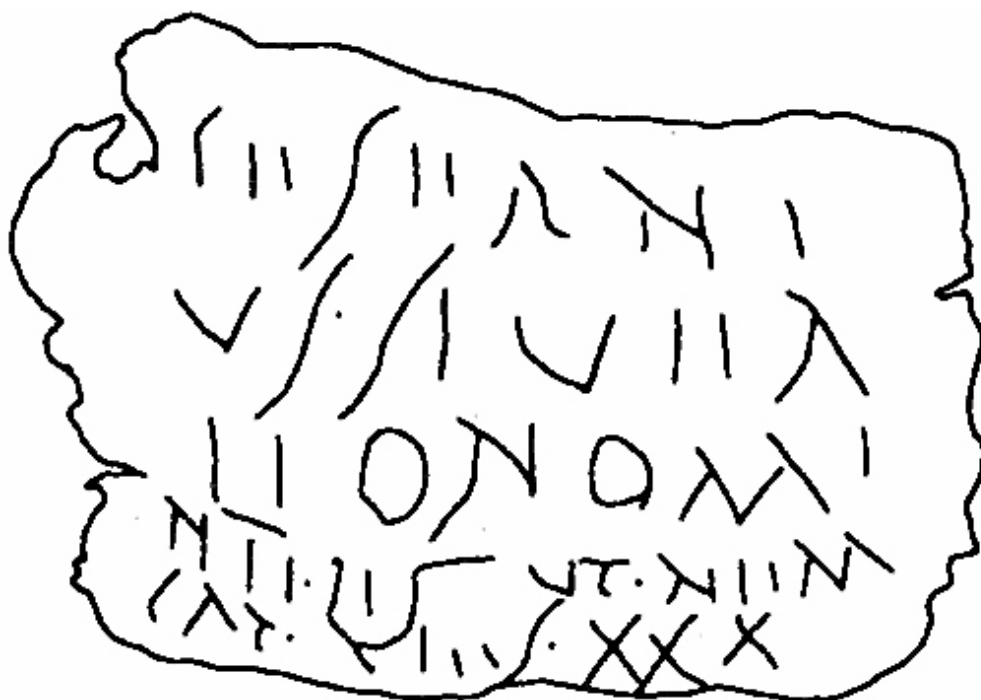
Fig. 3. Riproduzione grafica del lato A.