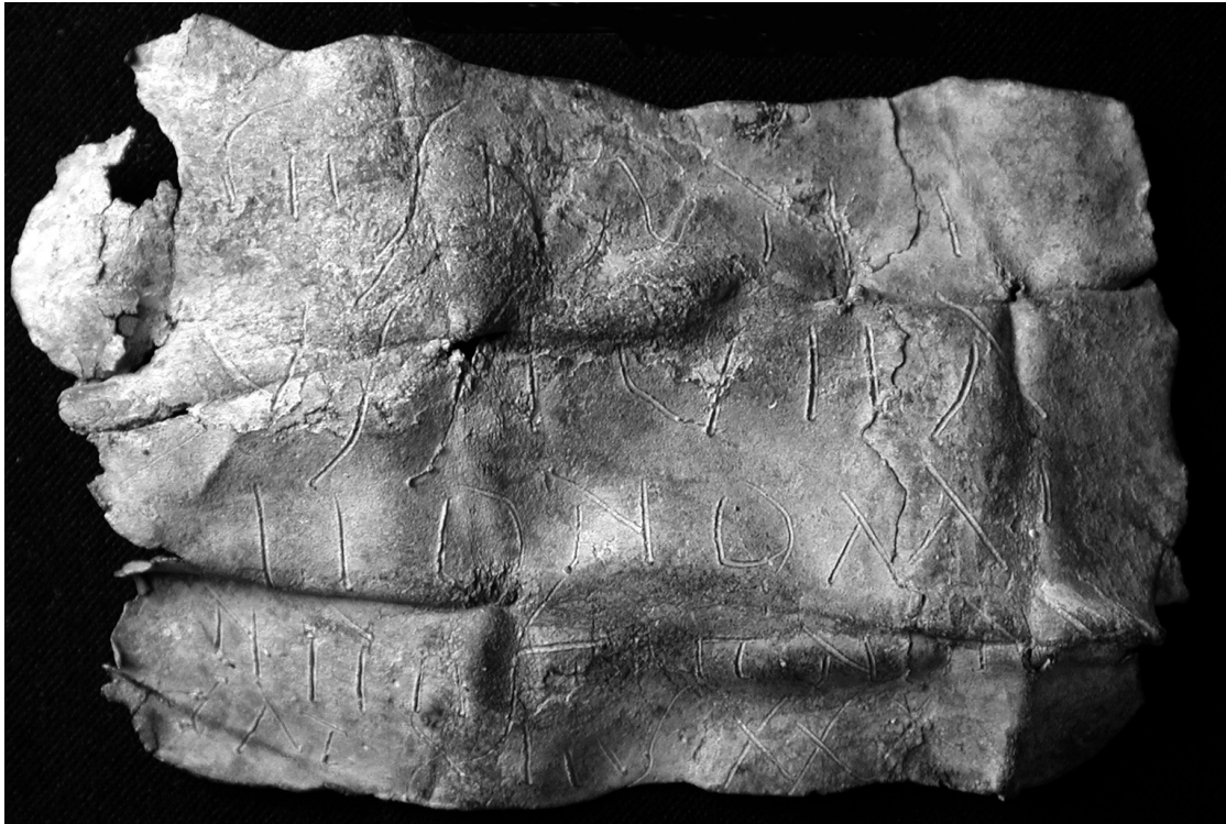
Fig. 1. Museo Archeologico Nazionale di Altino. Laminetta plumbea iscritta, lato A (nr. inv. AL 34891).