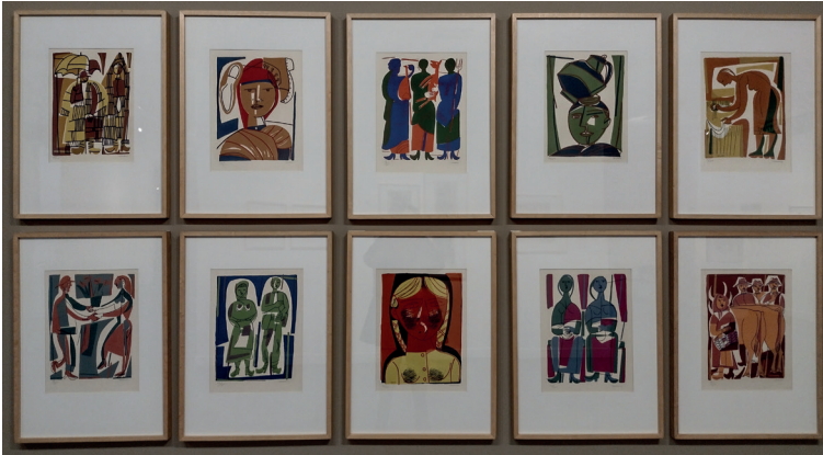
Figura 6 Luis Seoane, Campesinos . 1954. Serigrafía. Ediciones Galería Bonino, Buenos Aires. Colección Museo Nacional del Grabado, Buenos Aires. Cortesía Fundación Luis Seoane

cio de este artículo-, resulta un trabajo significativo dentro del proceso de validación del grabado original como modalidad artística en la Argentina, autonomizada respecto de su histórica función de ilustración literaria (Dolinko 2009).