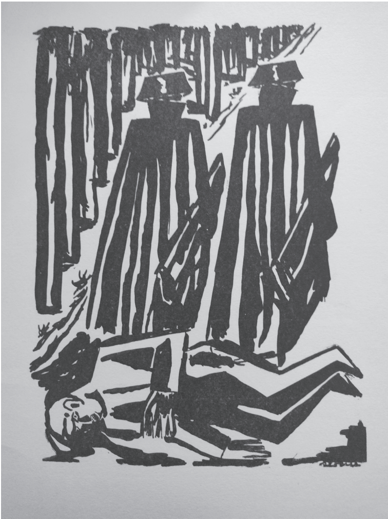
Figura 5 Luis Seoane, Tricornios . 1937. Tinta sobre papel. Incluido en la publicación Trece estampas de la traición .