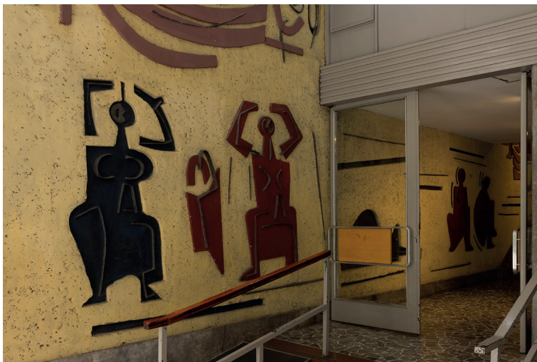
Figura 7 Luis Seoane, Las pescadoras . 1959. Fotografía Bruno Dubner. Reproducción por cortesía del proyecto Murales Seoane , Universidad Nacional de San Martín

fecha o título. En tal sentido, sería deseable y esperable que la visibilización de esta obra contribuya a su conocimiento y, por consiguiente, a su preservación y valoración. 7 Si la defensa de un legado cultural empieza por poder ver y saber más sobre el mismo –sobre las obras, sobre sus emplazamientos y archivos, sobre las instituciones o colecciones que las alojan–, pensar en su preservación material y en su estudio histórico es clave para sostener una memoria cultural compartida y compleja, y para difundir sus imágenes e idearios. La obra de Seoane, en este sentido, es clave cultural tanto para gallegos como para argentinos, para europeos como latinoamericanos.