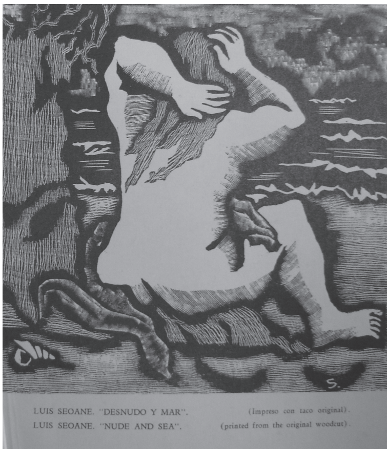
Figura 1 Luis Seoane, Desnudo y mar . 1942. Xilografía. Incluida en el libro 65 grabados en madera. La xilografía en el Río de la Plata (Buenos Aires: Plástica, 1943).

lló sus primeras experiencias profesionales hasta que, con el inicio de la Guerra Civil Española, retornó a su país natal escapando de la persecución falangista. Entre la década de 1930 y fines de los años setenta desarrolló una vasta obra artística y de gestión cultural, dinamizando desde su base porteña la producción cultural de los gallegos en la Argentina, a la vez que aportando su mirada cosmopolita a la modernización artística y editorial del país.