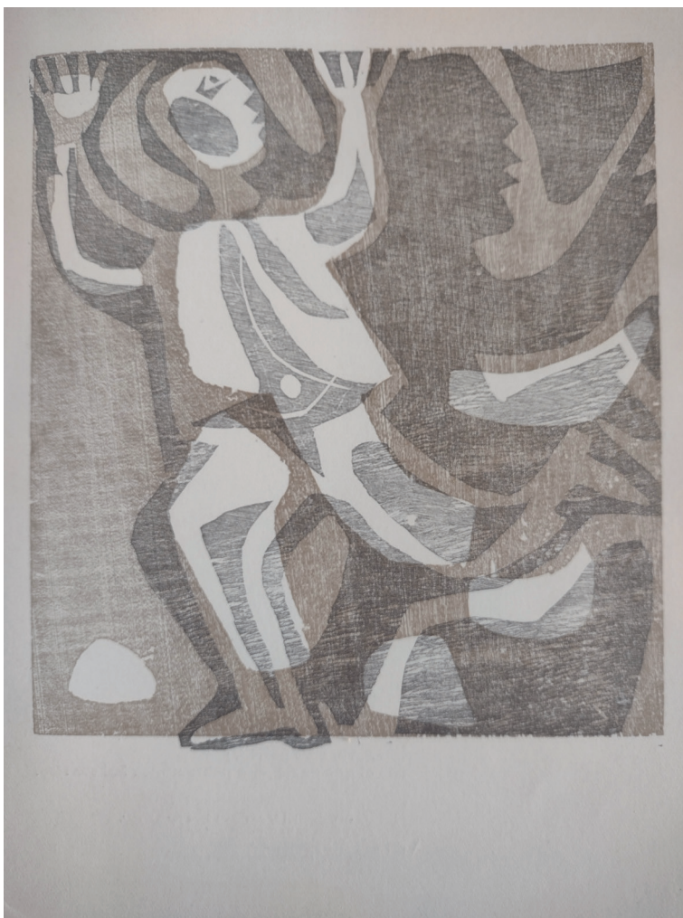
Figura 4 Luis Seoane, Al espantado la sombra le basta . 1965. Xilografía. Incluida en el libro 32 refranes criollos (Buenos Aires: Eudeba, 1965). Cortesía Fundación Luis Seoane

de la galería de arte Bonino, una de las más relevantes del dinámico circuito de galerías de Buenos Aires desde los años cincuenta (Díez Fischer et al. 2019). Si al momento de su fallecimiento en 1979 las notas necrológicas dieron buena cuenta de esa valoración, las numerosas exposiciones llevadas adelante en diversas ciudades del mundo luego de su muerte (A Coruña, Buenos Aires, Santiago de Chile, entre otras) y el interés por su obra en el mercado de arte reafirman la pervivencia de esta valoración.