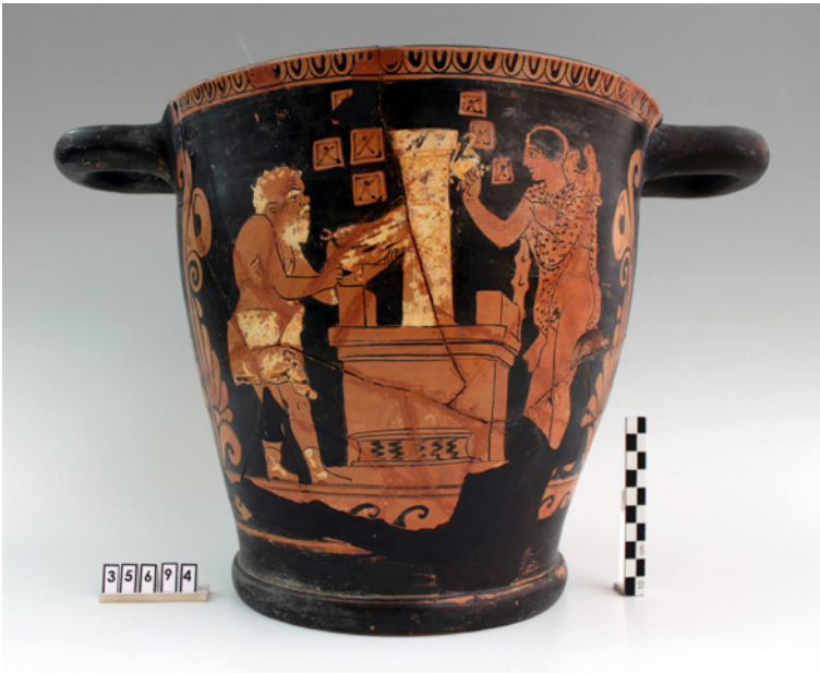
Figure 1 Gela, Mus. Arch. Naz. 35694, Siceliot (?) skyphos , side A.

This suggestion does not persuade me, first because the piglet sacrifice was no secret at all; 67 therefore, we are not bound to place those fragments in one of the allegedly scandalous plays. Second, the list of those plays may have been written down as a learned conjecture, given Aristotle's testimony on Aeschylus' prosecution. 68