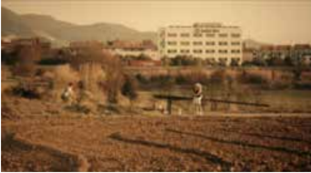
Figura 7. Fotograma de La plaga