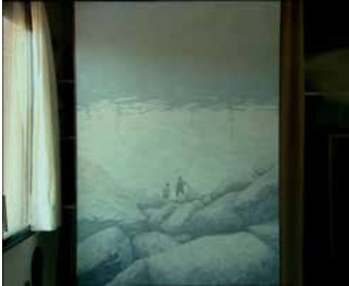
Figura 4. Fotograma de El cielo gira