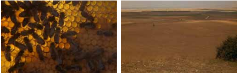
Figuras 2-3. Fotograma de El espíritu de la colmena

represión franquista implícita: la colmena, la relación de las dos hermanas, los cuadros religiosos, el tratado de Fernando sobre apicultura, las setas venenosas; y d) la reflexión sobre el propio discurso cinematográfico: como cuando Isabel le explica a Ana que «en el cine todo es mentira».