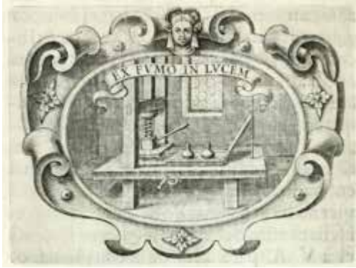
Figura 1. Emblema que encabeza el prólogo al lector de la edición impresa en Milán en 1642

La emulación aparece como una actividad instructiva y como un estímulo para la producción literaria, y es en este sentido que debe ser interpretada también la referencia a la 'envidia', con una connotación positiva y como aliciente para lograr la fama en el manejo de la pluma. Otro paralelismo entre ambas obras, y que muy probablemente no sea fruto de la casualidad, es la referencia al material sobre el que se hacían los grabados, que aparece mencionado en el fragmento anterior ('tomar el buril para abrir adulaciones en el bronce'), y que vuelve a aparecer en República literaria , donde el artista murciano estaba esculpiendo en puertas de 'bronce o metal corintio'.