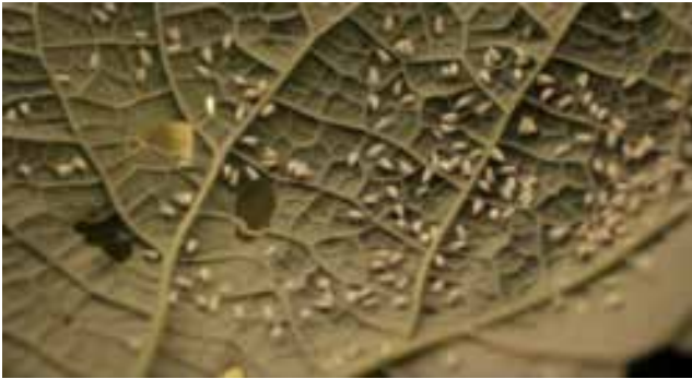
Figura 8. Fotograma de La plaga

El tercer leitmotiv , como hemos dicho, es la voz radiofónica de un meteorólogo, que aparece reiteradamente y se convierte en hilo conductor del relato. 10 Con sus progresivos pronósticos de condiciones de sequía y de calor asfixiante típicas del verano catalán se aumenta la sensación de angustia por la situación de la cosecha ecológica de Raül. A su vez, este motivo reiterado recuerda la estrecha dependencia que se tiene de la naturaleza en el trabajo del campo, conexión que se pierde en la sociedad urbanita. En palabras del padre de Raül: «Al camp, les feines s’han de fer com s’han de fer [...] Les feines del camp s’han de fer, cada cosa al seu moment [...] S’ha buscat una feina que al camp no hi ha hores».