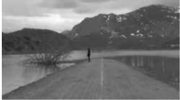
Figura 6. Fotograma de Los materiales

las características semánticas de los ríos, Enric Bou afirma que: