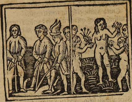
P. OVIDII NASONIS FASTORVM LIBER QVINTVS.